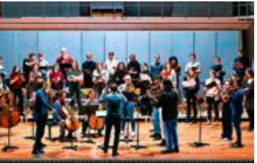
Kammerorchester der Musikhochschule Lübeck