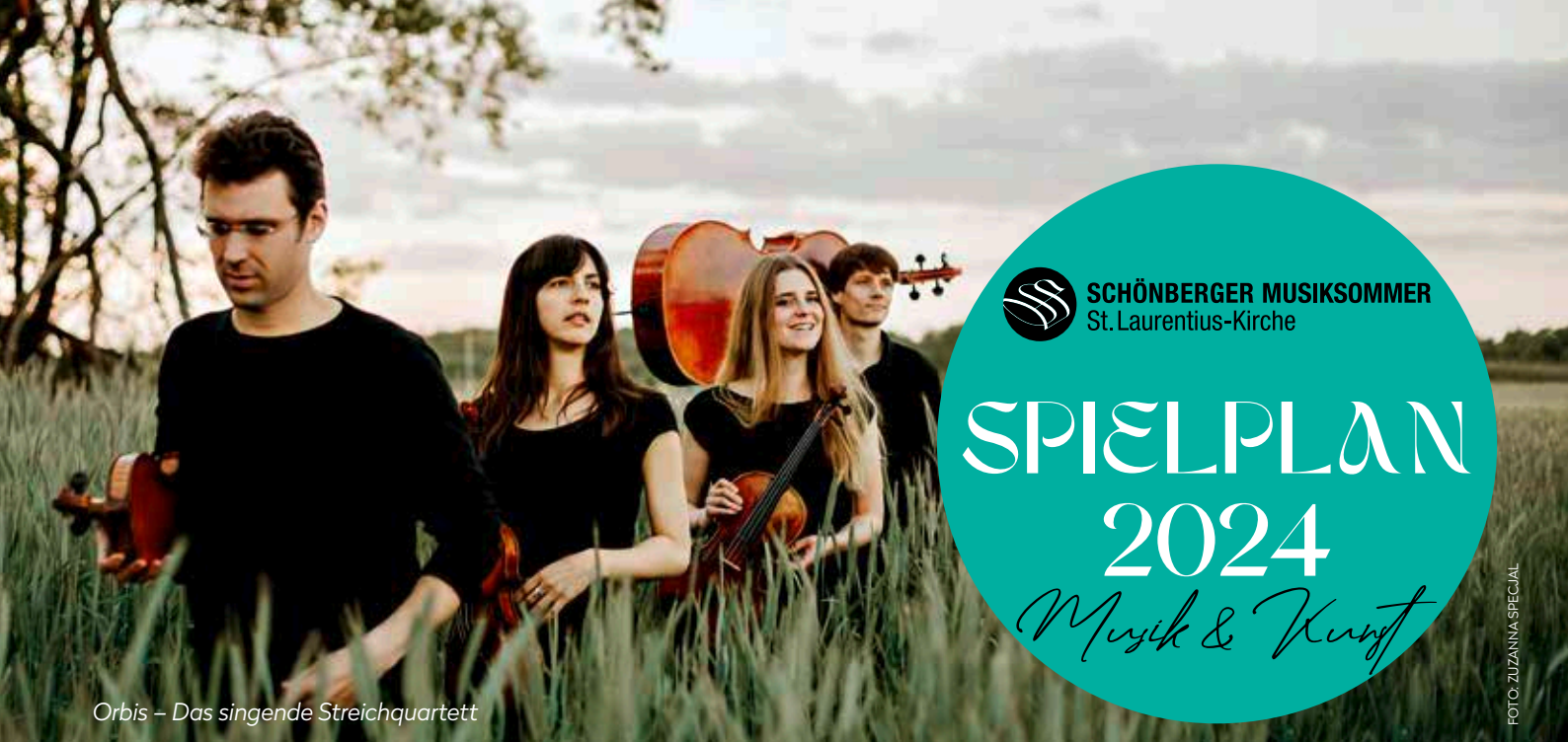
Orbis – Das singende Streichquartett