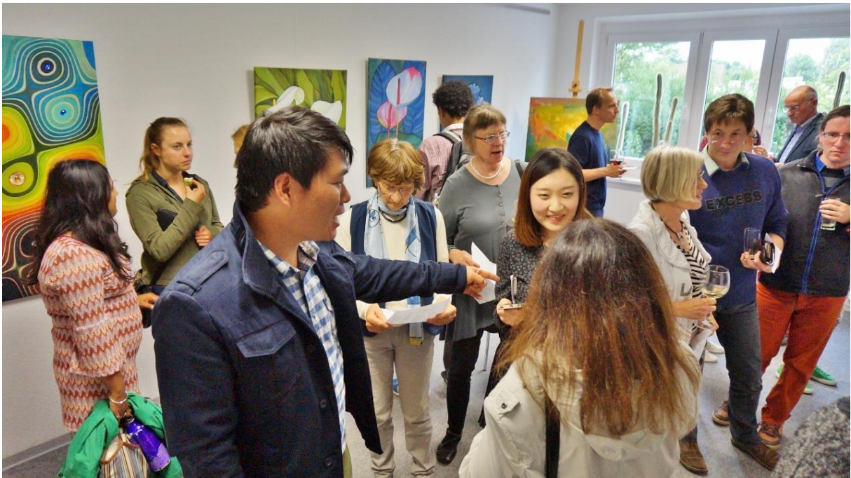
Bei der Vernissage am 24. Juni 2015