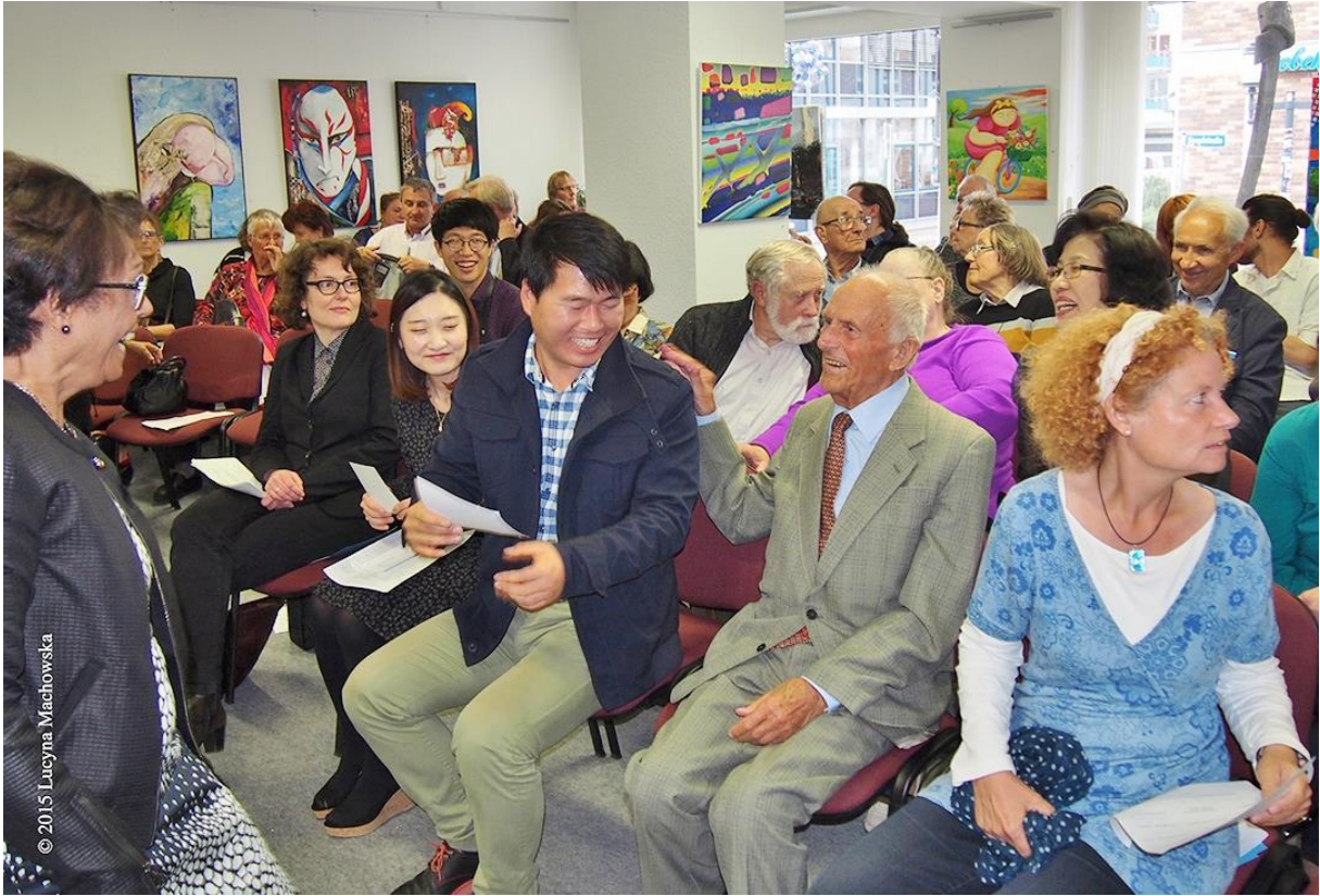
© 2015 Lucyna Machowska ..die Laune – gut