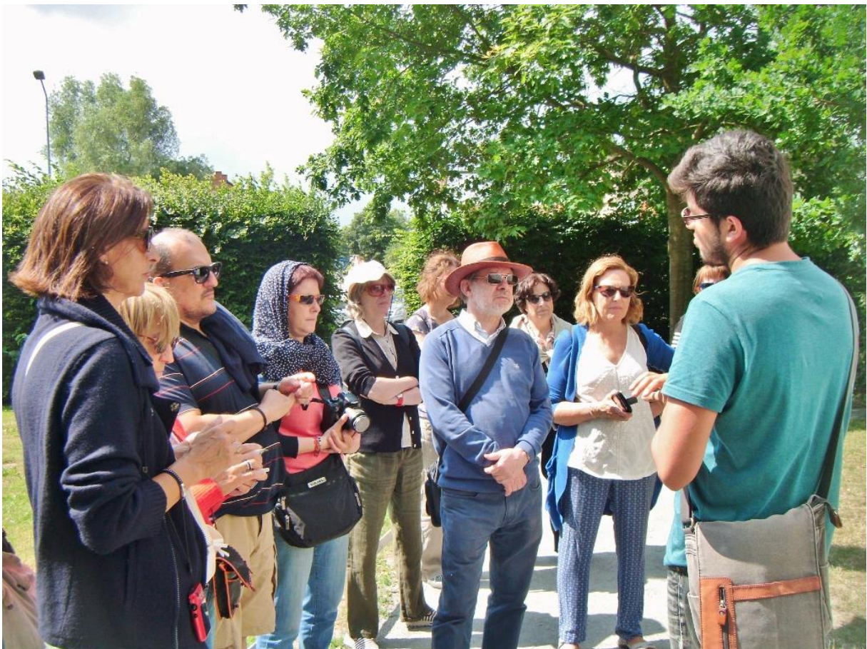
Kulturprogramm: Spanische Gäste in Eldena am 8. Juli 2015