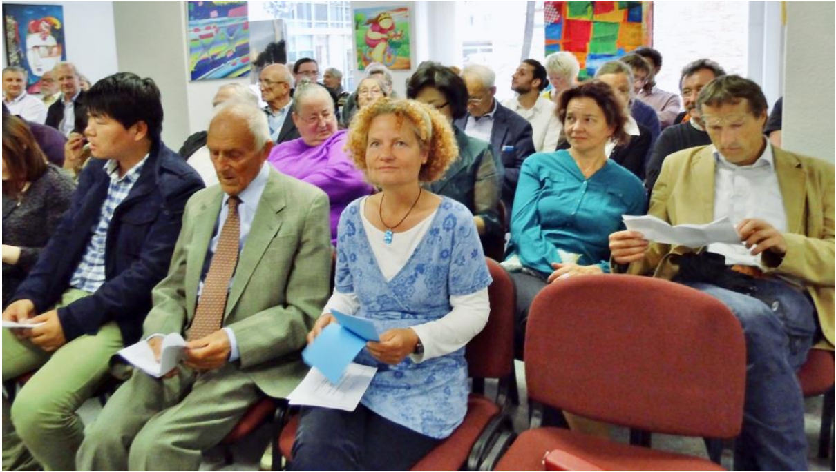
Vor der Eröffnung