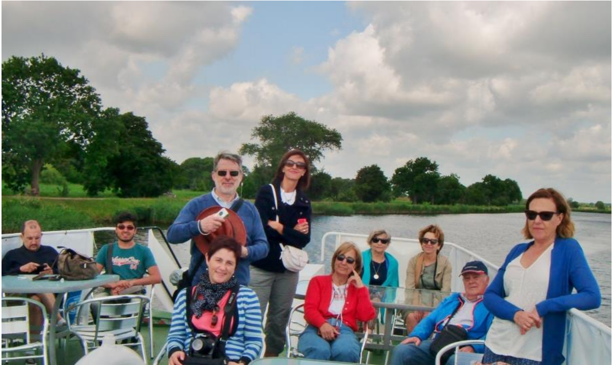
Kulturprogramm: Spanische Gäste bei dem Ausflug mit dem Schiff "Stubnitz" am 8. Juli 2015