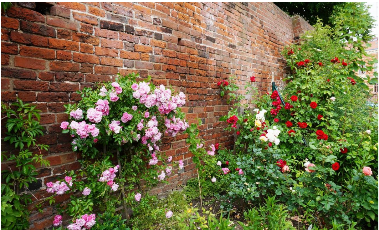
Kulturprogramm: Im Rosarium von Nadja Klüter am 26. Juni 2015