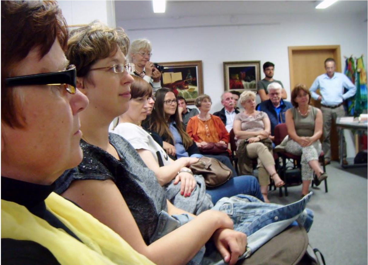
InterArt Greifswald 2015: Gäste im Pommernhus bei der Midissage am 8. Juli