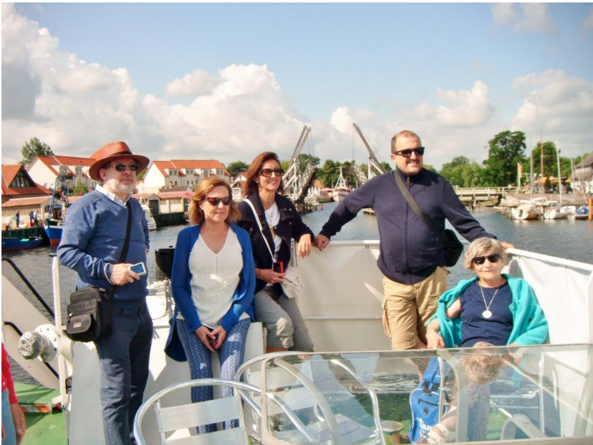
Kulturprogramm: Spanische Gäste bei dem Ausflug mit dem Schiff "Stubnitz" am 8. Juli 2015