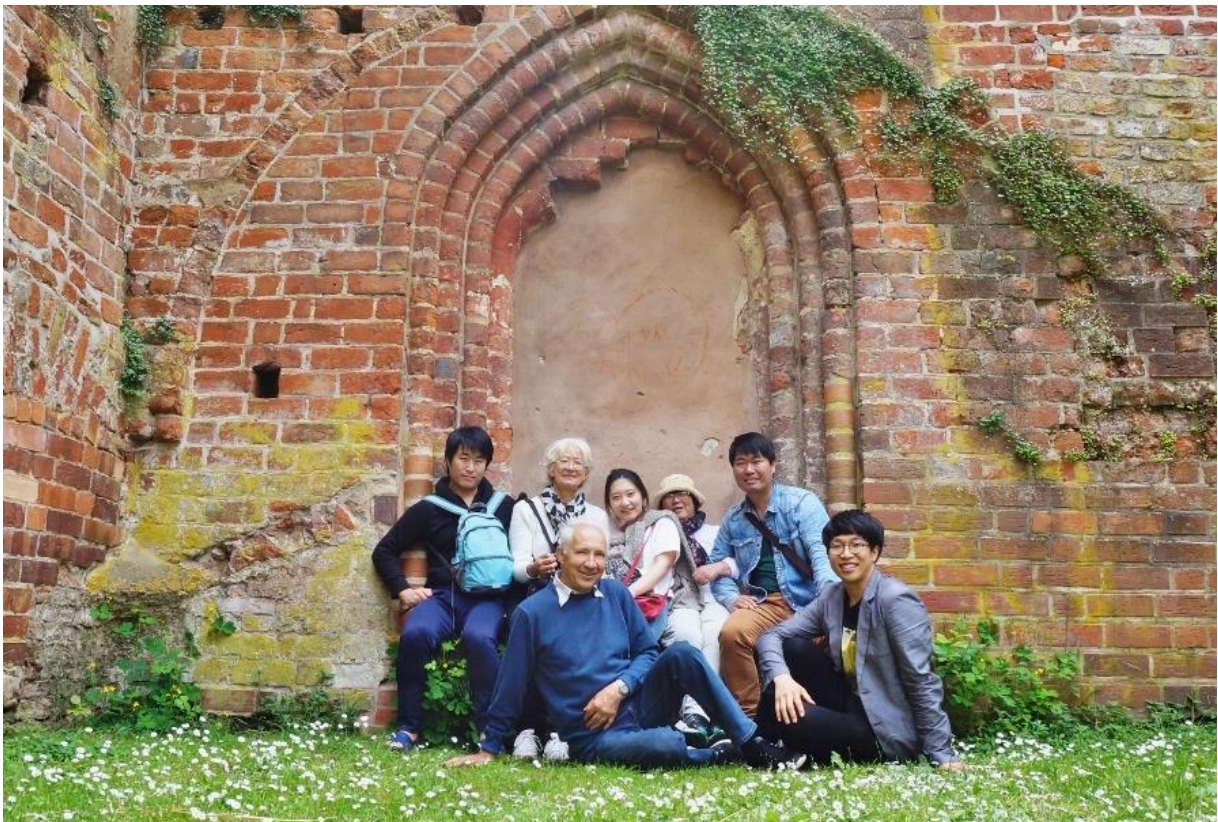
Kulturprogramm: Mit koreanischen Gästen in Eldena