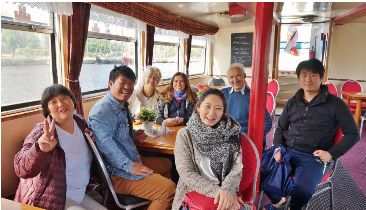
Kulturprogramm: Mit koreanischen Gästen auf dem Schiff „Stubnitz“ am 25. Juni 2015