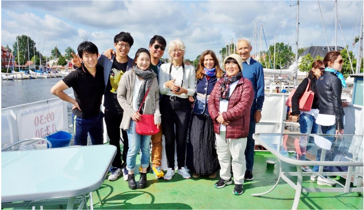
Kulturprogramm: Ausflug mit dem Schiff "Stubnitz" am 25. Juni 2015