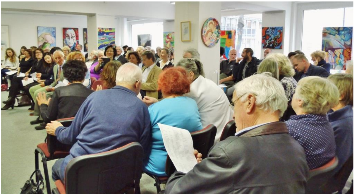
Die Halle war voll.