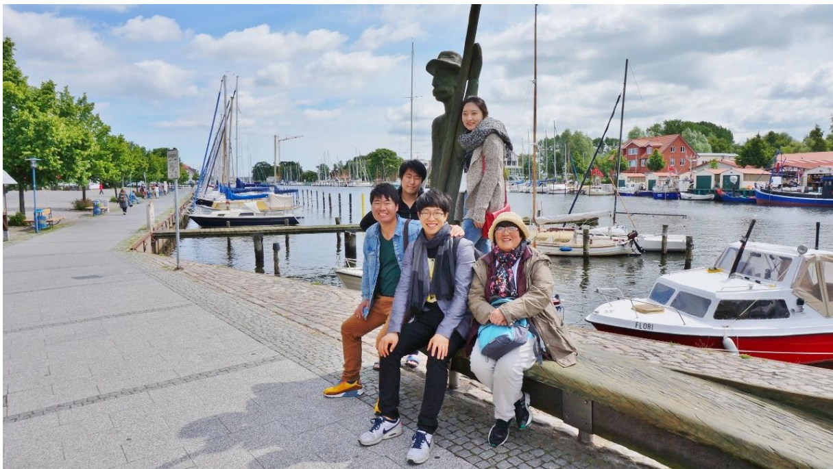
Kulturprogramm: Koreanische Gäste in Wick