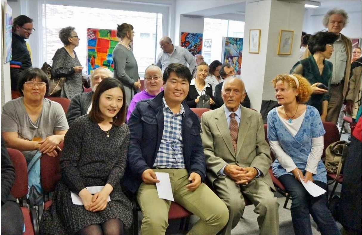
Vor der Vernissage