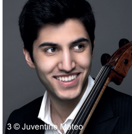
3 © Juventina Mateo