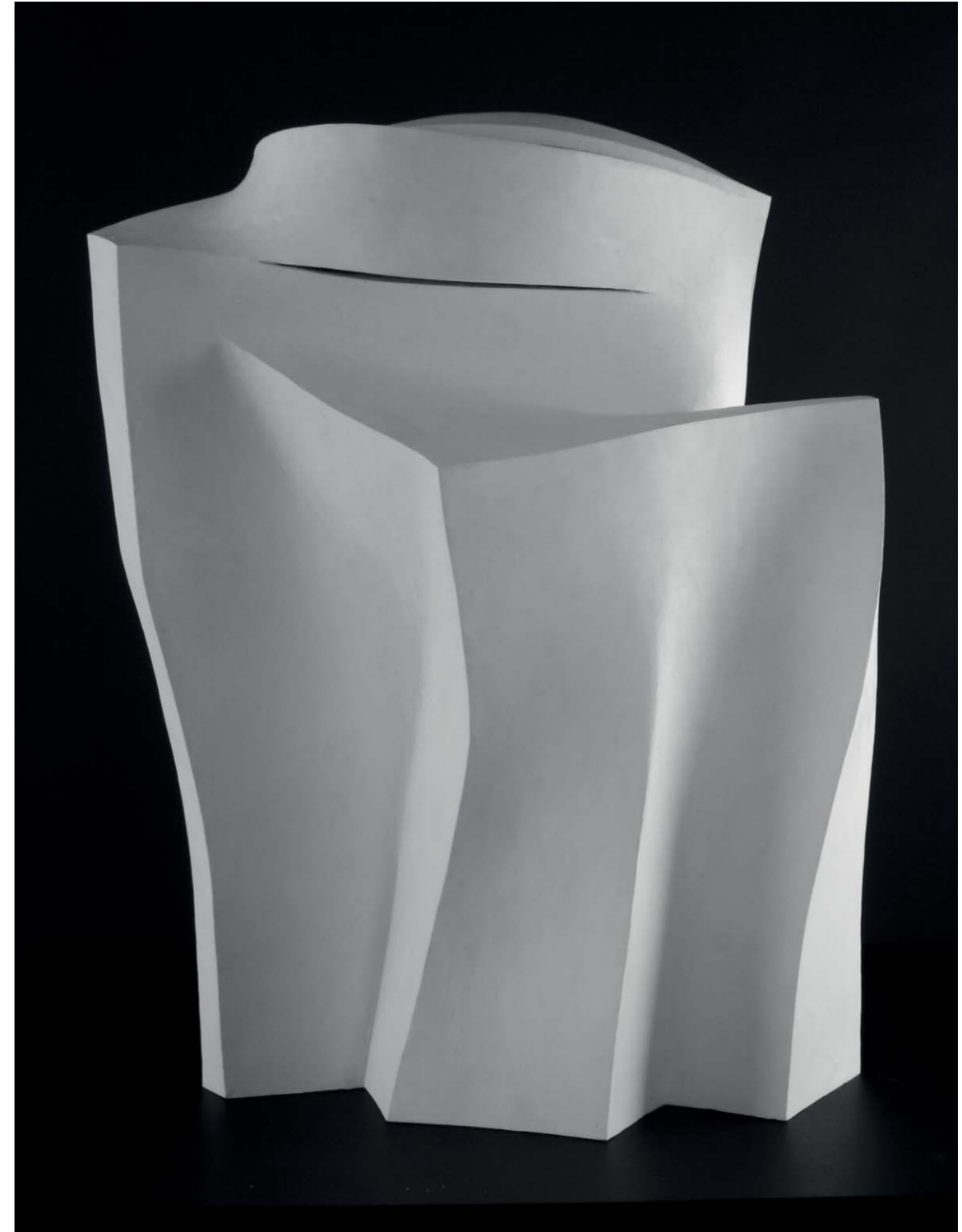
Archiskulptur 2016 Gips, 00 cm x 00 cm x 00 cm